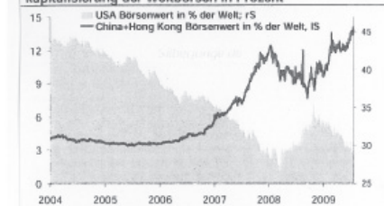
1.4 Börsenwert: Anteil der USA und Chinas an der Marktkapitalisierung der Weltbörsen in Prozent